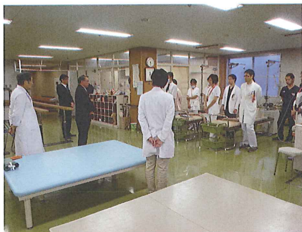
浜坂病院「仕事始め式」