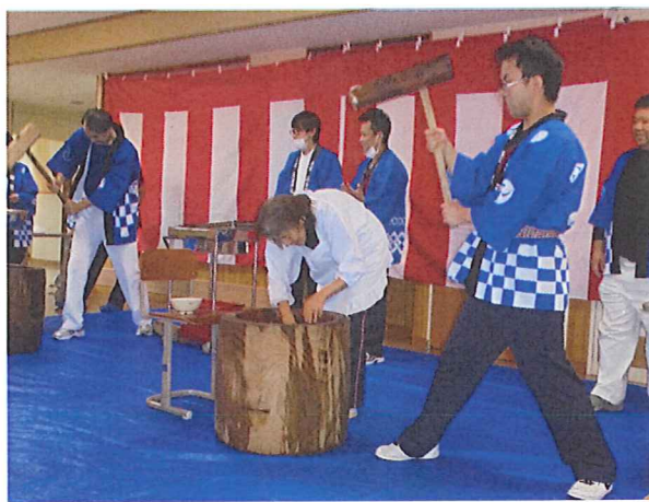
ささゆり「もちつき大会」