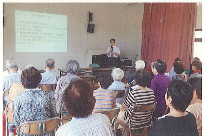
(各地区の巡回講座の様子)